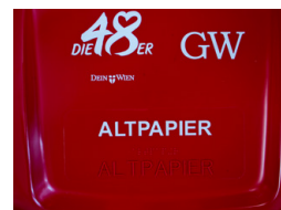
Heißprägung Hot stamping