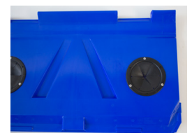
Glaseinwurföffnung (Standard Ø 160mm, Sondermaß Ø 190mm) Glass inlet opening (Standard Ø 160mm, Special size Ø 190mm)