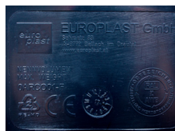
Reliefprägung Relief moulding

Für Ein-Mann-Aufnahme For one-man lifting system